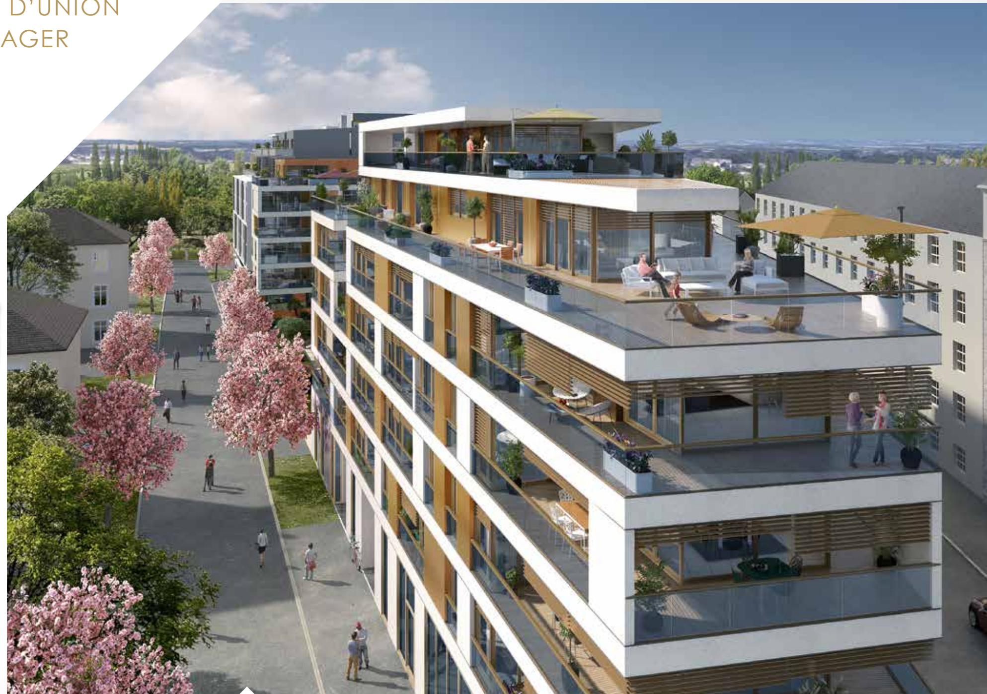
VISUEL BÂTIMENT 1

UN EMPLACEMENT PRIVILÉGIÉ, UN LIEU DE VIE À PROXIMITÉ IMMÉDIATE DES LOISIRS ET DE LA VIE ACTIVE.