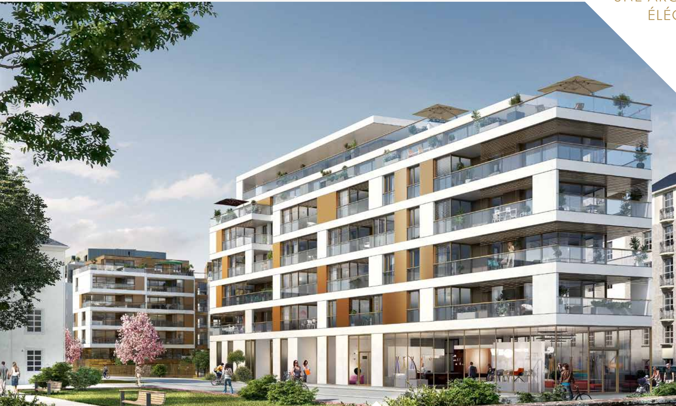
VISUEL BÂTIMENT 1