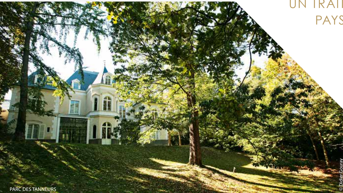
PARC DES TANNEURS