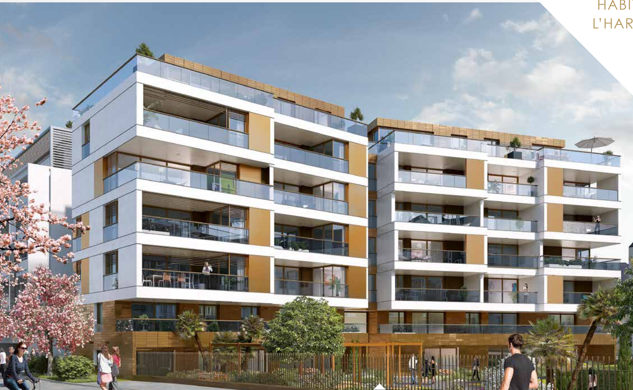
VISUEL BÂTIMENT 3